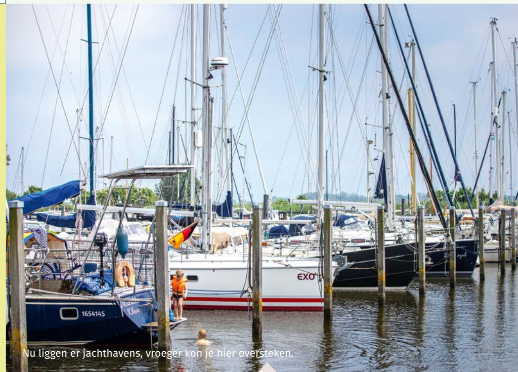
Nu liggen er jachthavens, vroeger kon je hier oversteken.