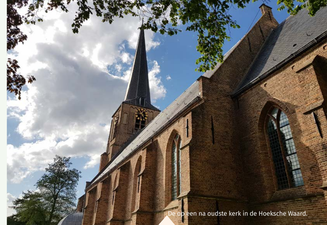
De op een na oudste kerk in de Hoeksche Waard.